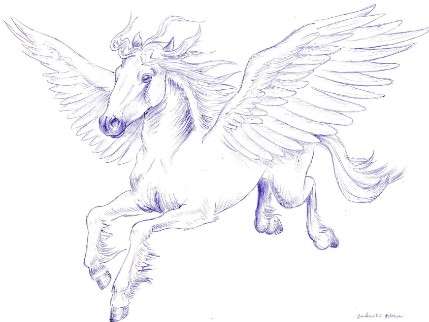
Bukovics Ádám 7.a: Pegazus