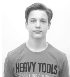
Major Soma 8.b Kiemelkedő idegen nyelvi teljesítményéért