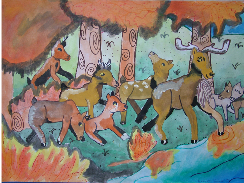
Málics Lilla 6.a: Erdőtűz