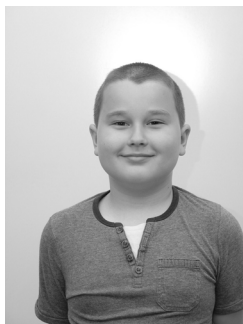
Pass Dominik 2.a