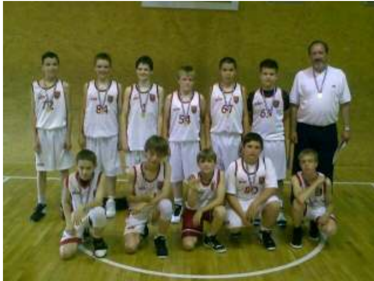
Kosárlabda Diákolimpia Elődöntő– aranyérmes csapat