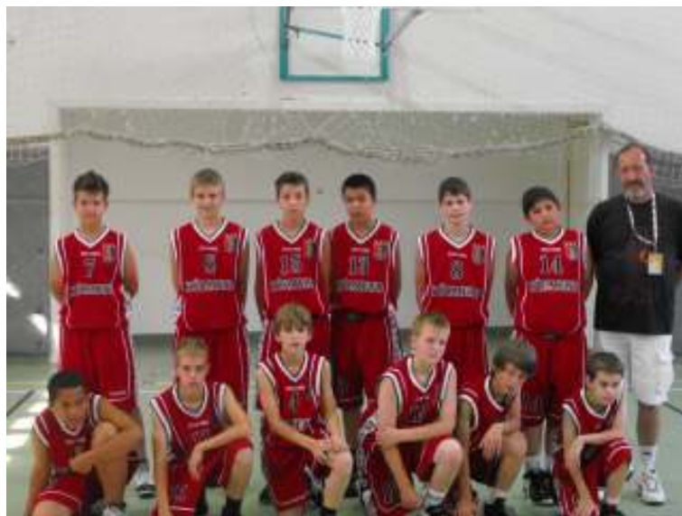
Kosárlabda Diákolimpia Döntő